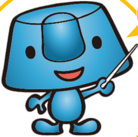
データサイトキャラクター マリネリくん

2013年9月7日にサイトオープンした「みんなのデータサイト」は、皆様のご協力により食品検体 8,000 件に及ぶデータを蓄積、提供する形になりました。これまでご協力を頂きました皆様に、心より感謝申し上げます。